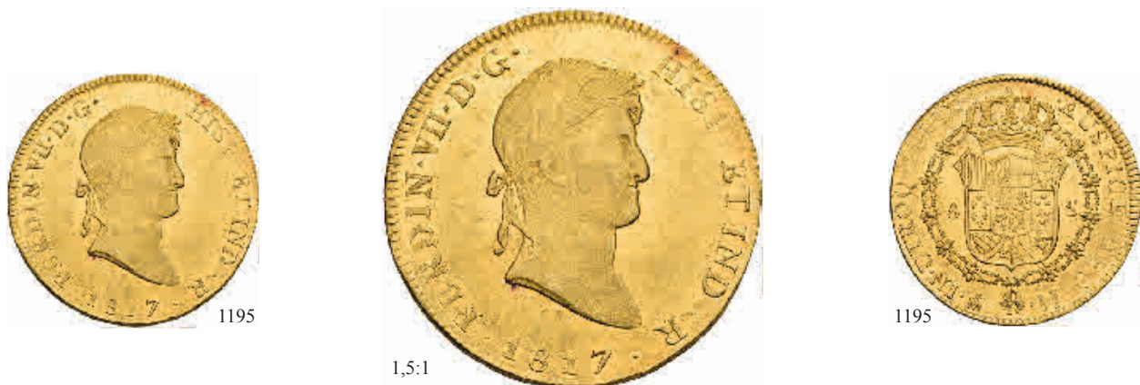
1195 Fernando VII. 8 escudos. 1817. México. JJ. AU 27,05 g. 36,7 mm. AC-1795; Onza-1267; VI-1491. Encapsulada por NGC AU 58 (8433772-004). R.B.O. 2500

Ferdinand VII. 8 escudos. 1817. Mexico. JJ. AU 27.05 g. 36.7 mm. AC-1795; Onza-1267; VI-1491. Encapsulated by NGC AU 58 (8433772-004). Traces of original mint lustre.