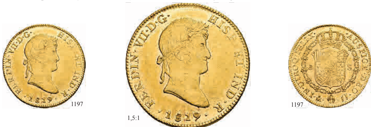
1197 Fernando VII. 8 escudos. 1819. México. JJ. AU 27 g. 37,2 mm. AC-1798; Onza-1270; VI-1493. Encapsulada por NGC AU 58 (8433772-006). B.O. 2600

Ferdinand VII. 8 escudos. 1818. Mexico. JJ. AU 26.99 g. 37.1 mm. AC-1797; Onza-1269; VI-1492. Encapsulated by NGC AU 53 (8433772-005). Traces of original mint lustre.