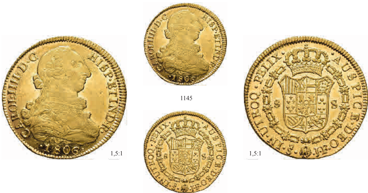
1145 Carlos IV. 8 escudos. 1806. Santiago. JF. AU 27,04 g. 37,5 mm. AC-1779; Onza-1182; VI-1433. Encapsulada por NGC MS 60 “Top Pop” (8433334-009). Hojitas sin saltar en anv. B.O. 2800

Charles IV. 8 escudos. 1806. Santiago. FJ. AU 26.99 g. 37 mm. AC-1778; Onza-1181; VI-1432. Encapsulated by NGC AU 58 (8433334-008). Small marks. Original mint lustre.