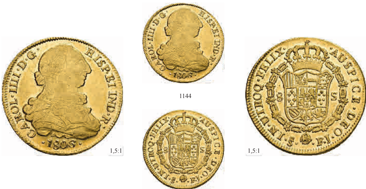
1144 Carlos IV. 8 escudos. 1806. Santiago. FJ. AU 26,99 g. 37 mm. AC-1778; Onza-1181; VI-1432. Encapsulada por NGC AU 58 (8433334-008). Pequeñas marcas. B.O. 2700

Charles IV. 8 escudos. 1806. Santiago. FJ. AU 26.99 g. 37 mm. AC-1778; Onza-1181; VI-1432. Encapsulated by NGC AU 58 (8433334-008). Small marks. Original mint lustre.