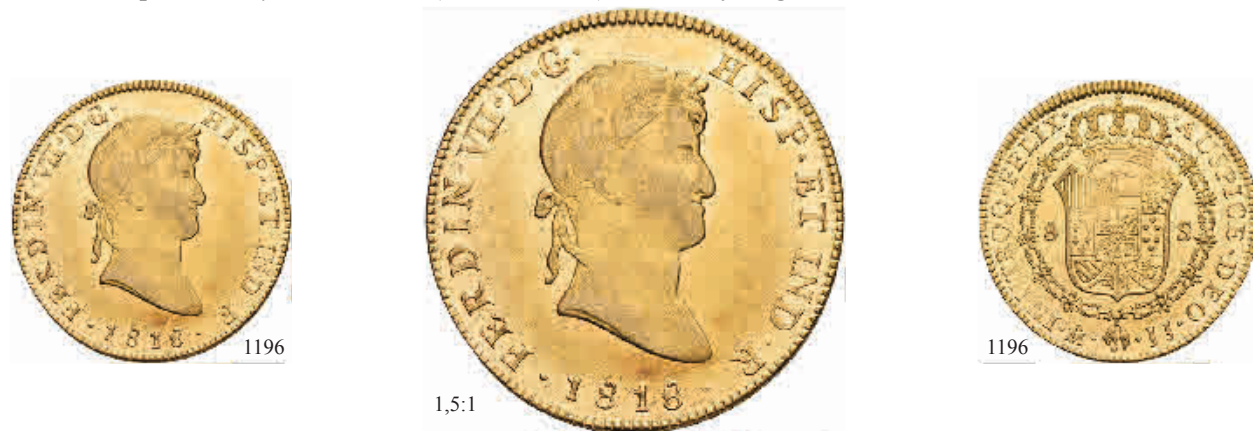
1196 Fernando VII. 8 escudos. 1818. México. JJ. AU 26,99 g. 37,1 mm. AC-1797; Onza-1269; VI-1492. Encapsulada por NGC AU 53 (8433772-005). R.B.O. 2500

Ferdinand VII. 8 escudos. 1817. Mexico. JJ. AU 27.05 g. 36.7 mm. AC-1795; Onza-1267; VI-1491. Encapsulated by NGC AU 58 (8433772-004). Traces of original mint lustre.